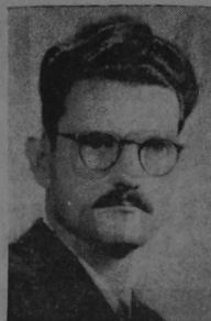
FABIÁN DOBLES, uno de los mejores escritores nacionales, autor de "EL SITIO DE LAS ABRAS"

EL SITIO DE LAS ABRAS, la novela que acaba de ser premiada en un concurso centroamericano promovido en Guatemala, no es una novela más, sencillamente, de Fabián Dobles, que venga a sumar un nuevo escalón en la línea ascendente que este novelista ha seguido desde que publicó "ESE QUE LLAMAN PUEBLO", en 1942. No es, tampoco, una novela más de las que en los últimos años han aparecido entre nosotros, y que han dado fisonomía propia a una literatura nacional, actualmente respetada y estudiada en el exterior.