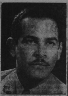
BLAS ROCA, Secretario General del Partido Socialista Popular de Cuba, cuyo discurso radial dando a conocer la nueva posición de su Partido, ha causado sensación en el mundo político de América Latina.

Que tal decisión satisface al pueblo lo demuestra el hecho de la acogida clamorosa de masas con que ha sido recibida. Como pocas veces, quizá, la opinión pública ha estado tan pendiente de las resoluciones de un partido, interés, que se transformó inme